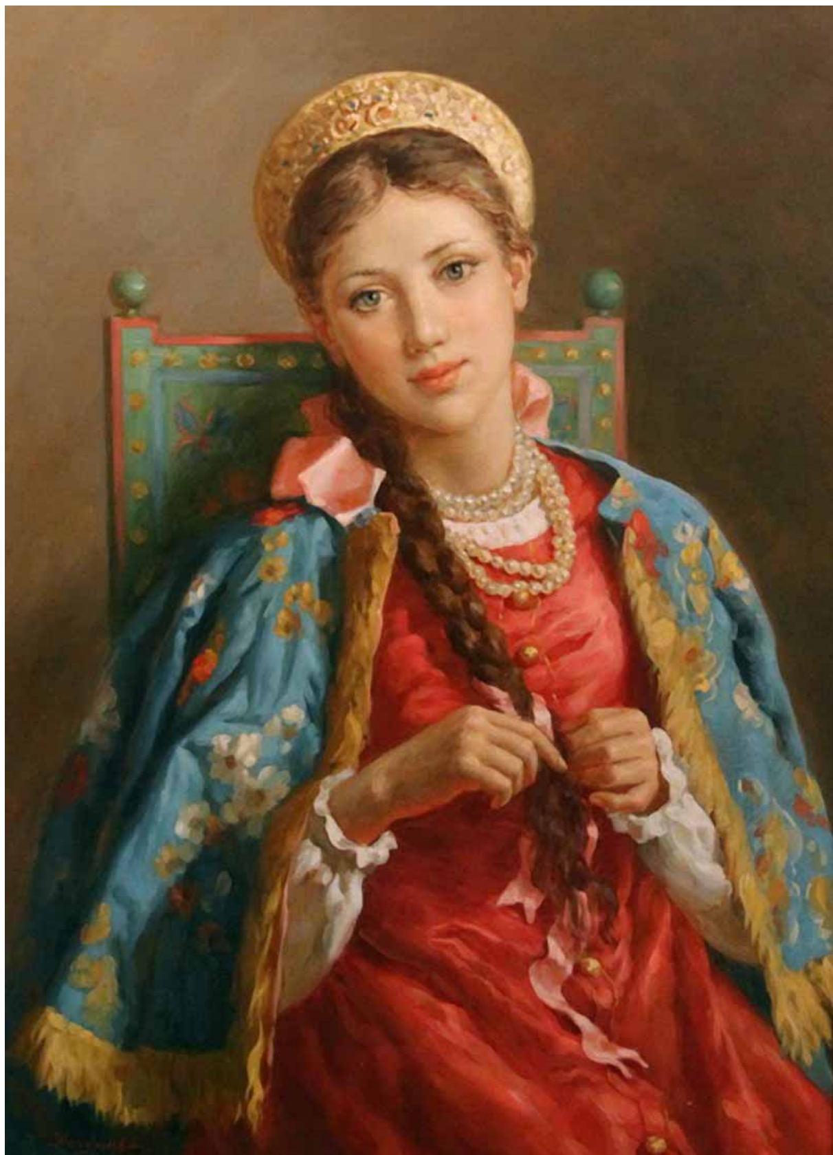
Tradiční sváteční oblečení ruské dívky