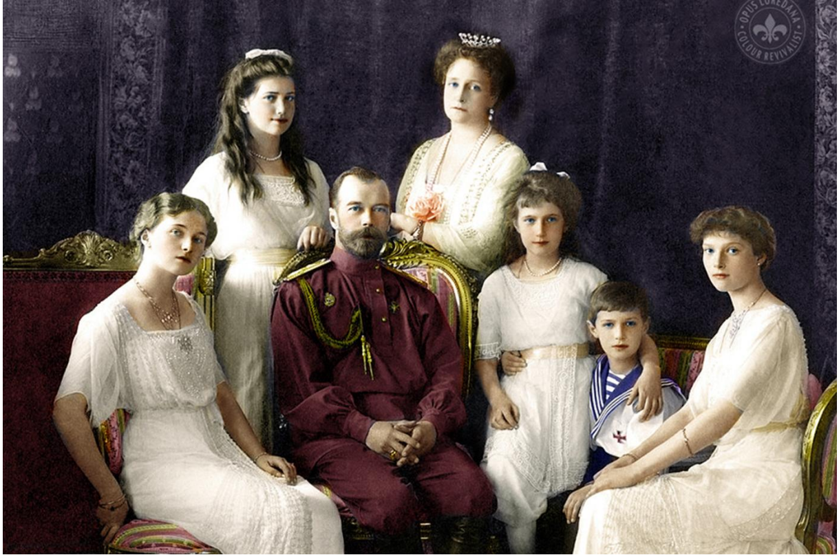
Car Mikuláš II. (Romanov) s rodinou – 1917 dobová fotografie; všichni popraveni