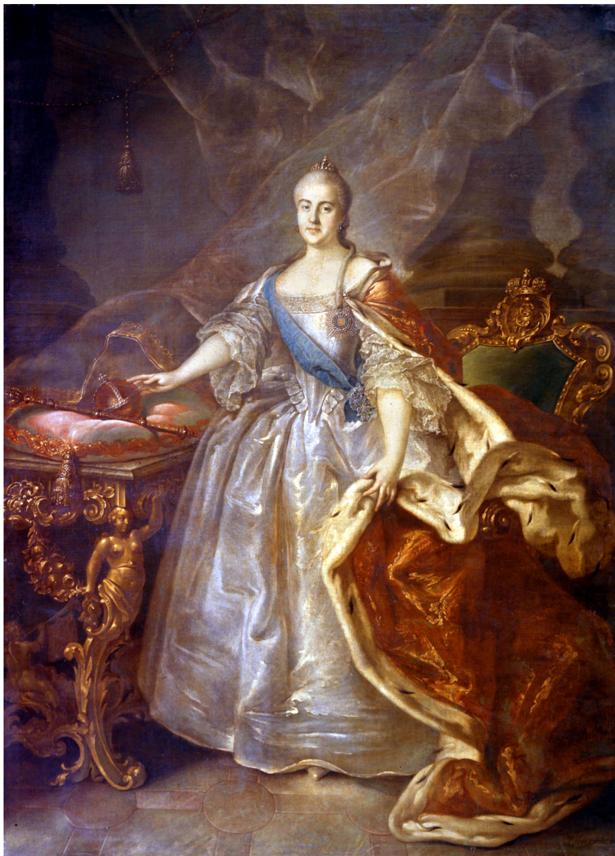
Kateřina II, ruská imperátorka - 1762