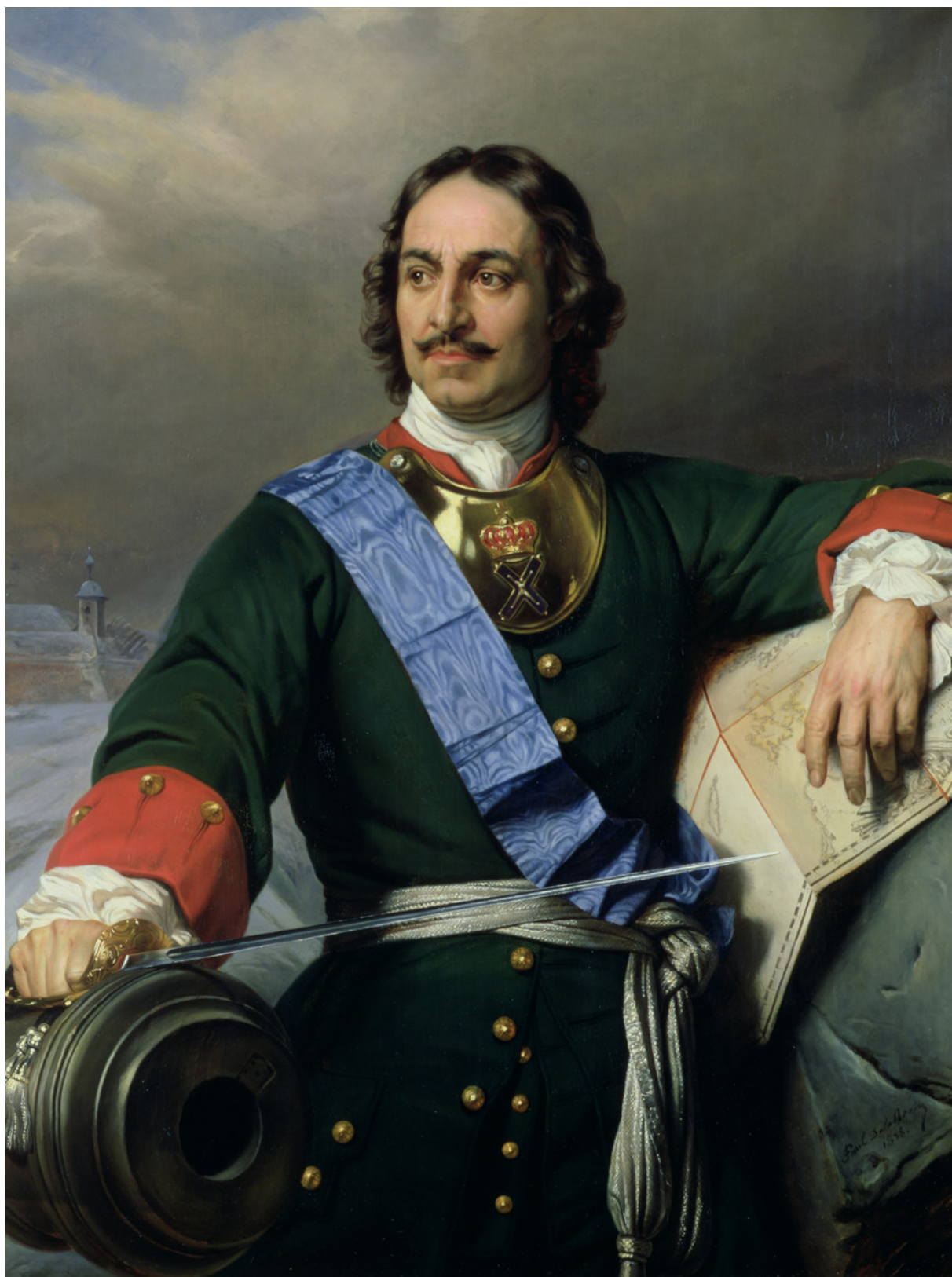
Car Petr I. Veliký, u moci 1682 - 1725