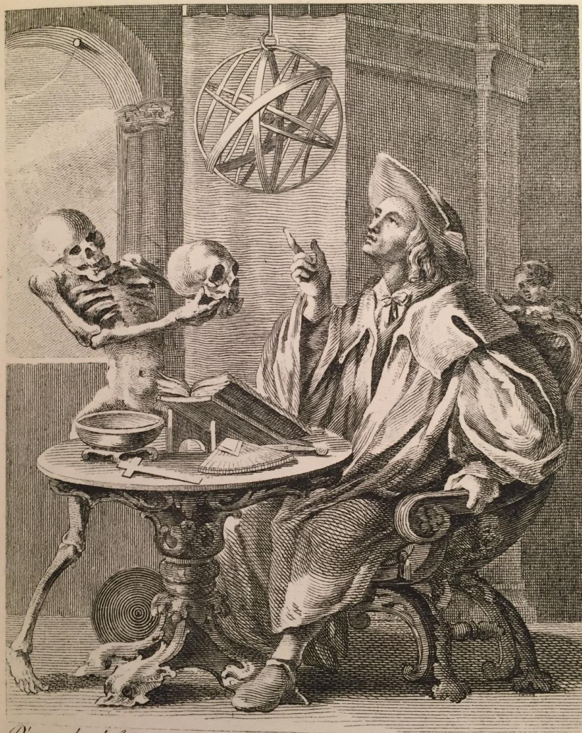
D'après les dessins de J. Holbein.